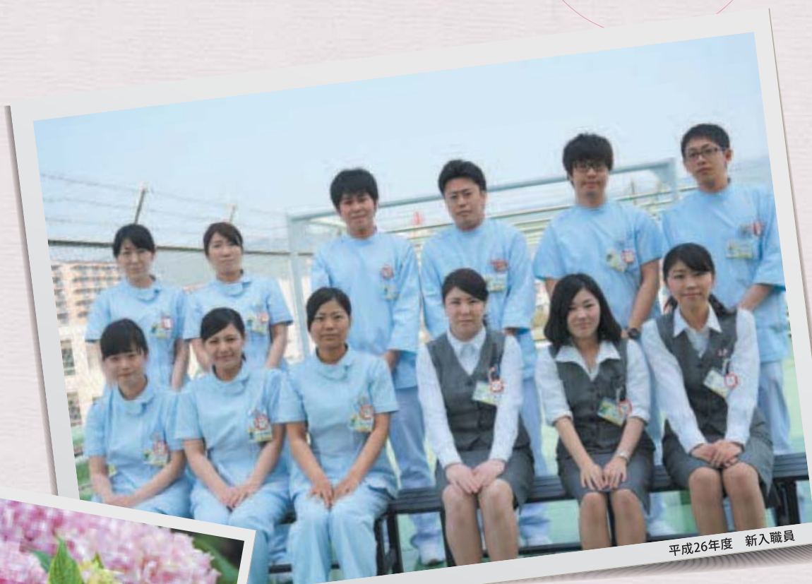
平成26年度 新入職員